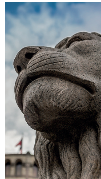
TRUSLER KAN FREMSETTES UT FRA IDEOLOGISKE, POLITISKE ELLER RELIGIØSE MOTIVER.

Selv om det jevnlig fremsettes trusler, forventes det at terskelen for å gjennomføre