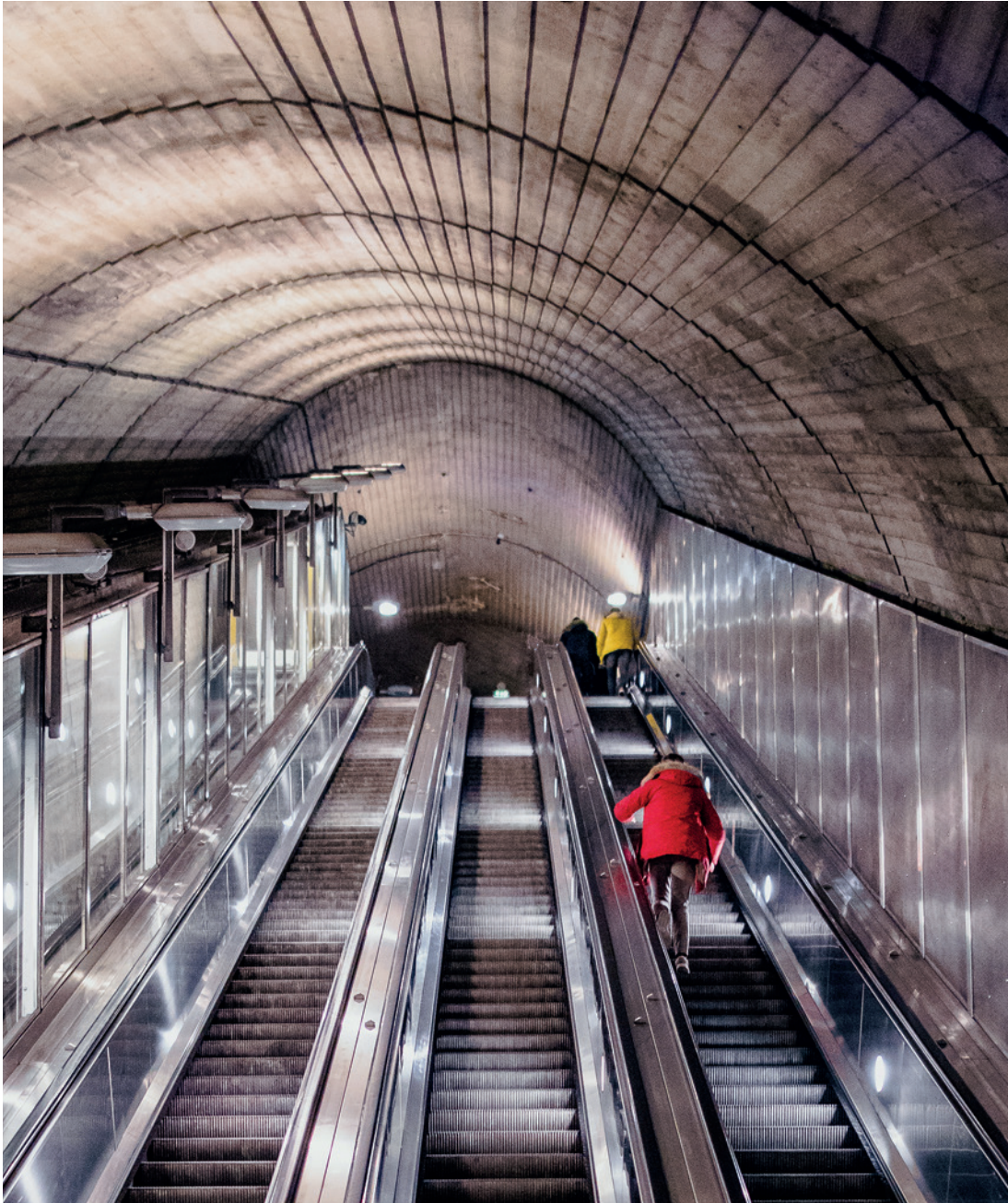
TRUSSELBILDET PREGES I DAG AV STABILE OG RELATIVT LANGVARIGE TRENDER OG UTVIKLINGSTREKK.