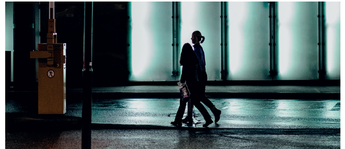
ENKELTHENDELSER KAN INNTREFFE BRÅTT OG FÅ STOR INNVIRKNING PÅ SAMFUNNET.

Dagens trusselbilde preges av stabile og relativt varige utviklingstrekk. Samtidig vet vi at enkelthendelser og episoder plutselig vil kunne inntreffe og få en stor og ofte uforutsigbar innvirkning på samfunnet. En vurdering av fremtiden vil derfor alltid være usikker.