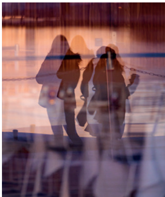
UTENLANDSKE RADIKALISATORER FORVENTES Å BIDRA TIL AT ENKELTE BLIR RADIKALISERT I NORGE I ÅR.

Fraværet av godt organiserte miljøer er positivt for trusselbildet, fordi slike miljøer tidligere har vist seg å være en viktig drivkraft for radikaliserings, rekruttering og utvikling av vilje til å gjennomføre terrorhandlinger.