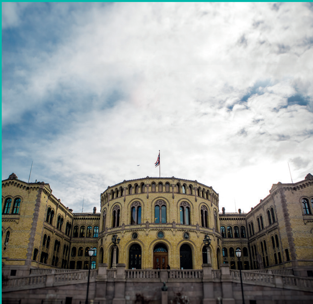
TRUSSELAKTIVITET RAMMER ENKELTPERSONER, MEN UTGJØR EN TRUSSEL MOT HELE DEMOKRATIET.

Selv om det jevnlig fremsettes trusler, forventes det at terskelen for å gjennomføre angrep mot myndighetspersoner fortsatt vil være høy. Slik aktivitet kan likevel ha en negativ påvirkning på det politiske arbeidet. Undersøkelser viser at flere myndighetspersoner har vegret seg for å fremme kontroversielle synspunkter i frykt for å bli utsatt for trusler.