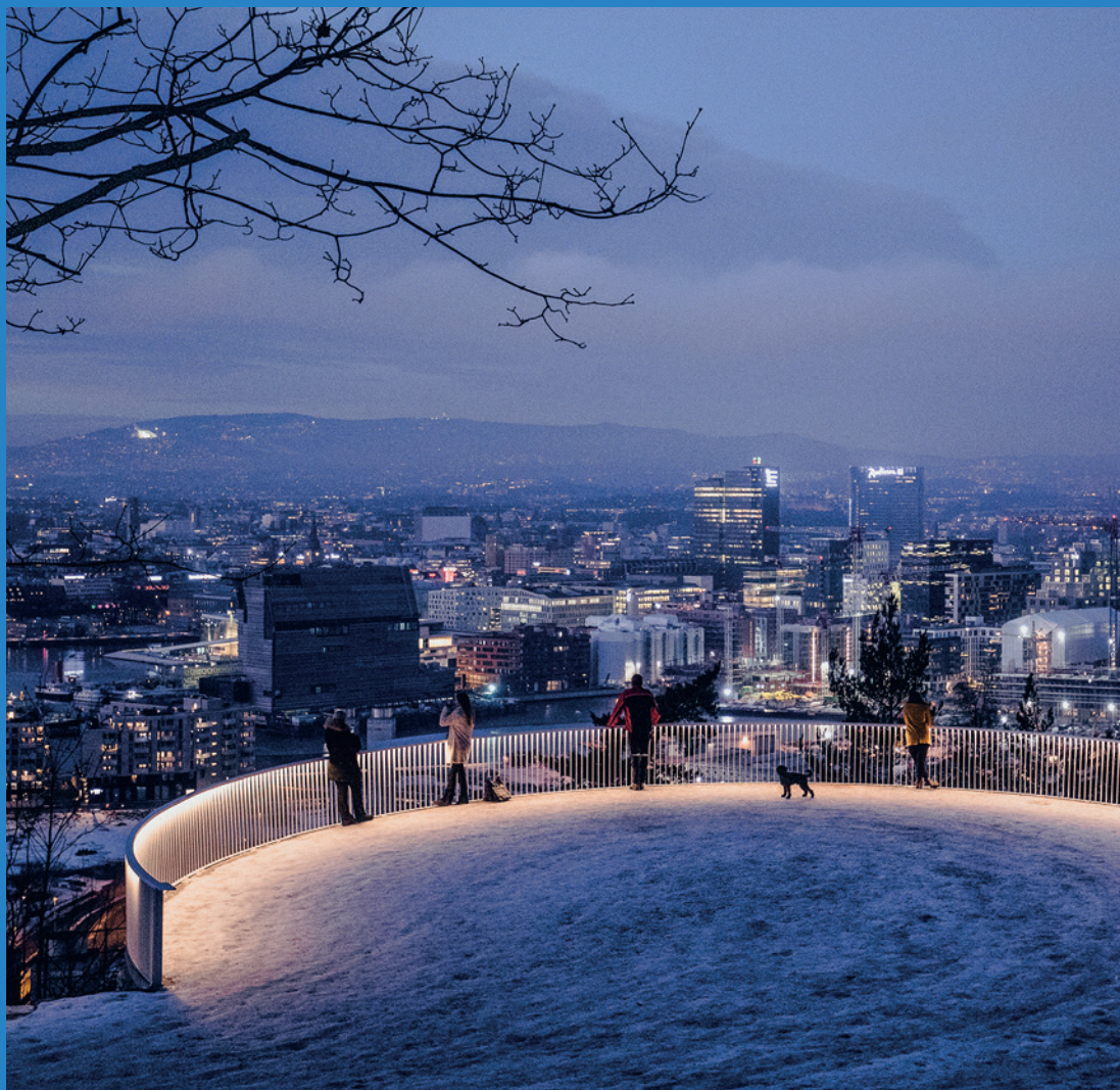
FREMMEDE ETTERRETNINGSTJENESTER VIL GJENNOMFØRE OPERASJONER MOT NORSKE MÅL OGSÅ I 2019.

I 2019 vil flere lands etterretningstjenester forsøke å rekruttere kilder og kartlegge personer og virksomheter i Norge. De vil også forsøke å skaffe seg urettmessig tilgang til norske virksomheters datanettverk. Formålet vil være å skaffe sensitiv informasjon og å påvirke beslutninger. Operasjonene til disse tjenestene vil rettes mot personer og virksomheter innen norsk statsforvaltning, kritisk infrastruktur, forsvar og beredskap, samt mot forskning og utvikling.