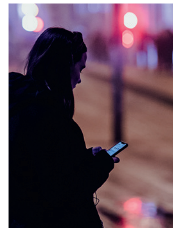
TILNÆRMING OG RELASJONER GJENNOM SOSIALE MEDIER ER EN EFFEKTIV FREMGANGSMÅTE FOR Å INNHENTE INFORMASJON.

I tillegg til at de tar kontakt under åpne arrangementer, forventer vi også å se tilfeller der etterretningstjenestene tilnærmer seg potensielle kilder gjennom sosiale medier. En vanlig fremgangsmåte er at en etterretningsoffiser under dekke av å ha en annen stilling, tar kontakt og innleder en relasjon via et faglig rettet nettforum. Over tid vil forholdet utvikle seg. Vedkommende vil kunne motta invitasjoner til møter og seminarer, samt få i oppdrag å utarbeide skriftlige rapporter, artikler eller kronikker mot betaling. Samarbeidet vil imidlertid være styrt av den fremmede etterretningstjenesten, enten for å påvirke norsk meningsdannelse og beslutninger eller for å få tilgang til sensitiv informasjon.