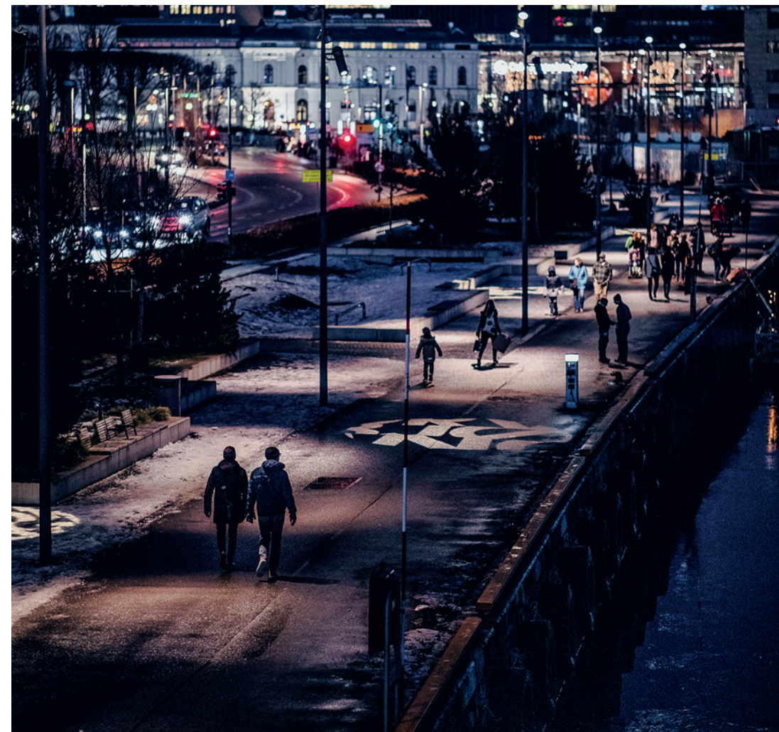
KJØRETØY, HUGG-/STIKKVÅPEN, IMPROVISERTE EKSPLOSIVE INNRETNINGER (IED-ER) OG SKYTEVÅPEN ER DE MEST AKTUELLE ANGREPSMIDLENE VED FORSØK PÅ EKSTREM ISLAMISTISK TERROR.

Norske venstreekstremer har kontakt med venstreekstremer i andre europeiske land. Dette vil representere en utfordring i 2019. Gjennom denne kontakten blir det norske miljøet knyttet inn i miljøer som har en langt lavere terskel for bruk av vold mot meningsmotstandere enn hva de norske miljøene har hatt de senere årene. Kontakten med venstreekstremer i andre europeiske land kan også inspirere til voldsutøvelse mot meningsmotstandere i Norge. ■